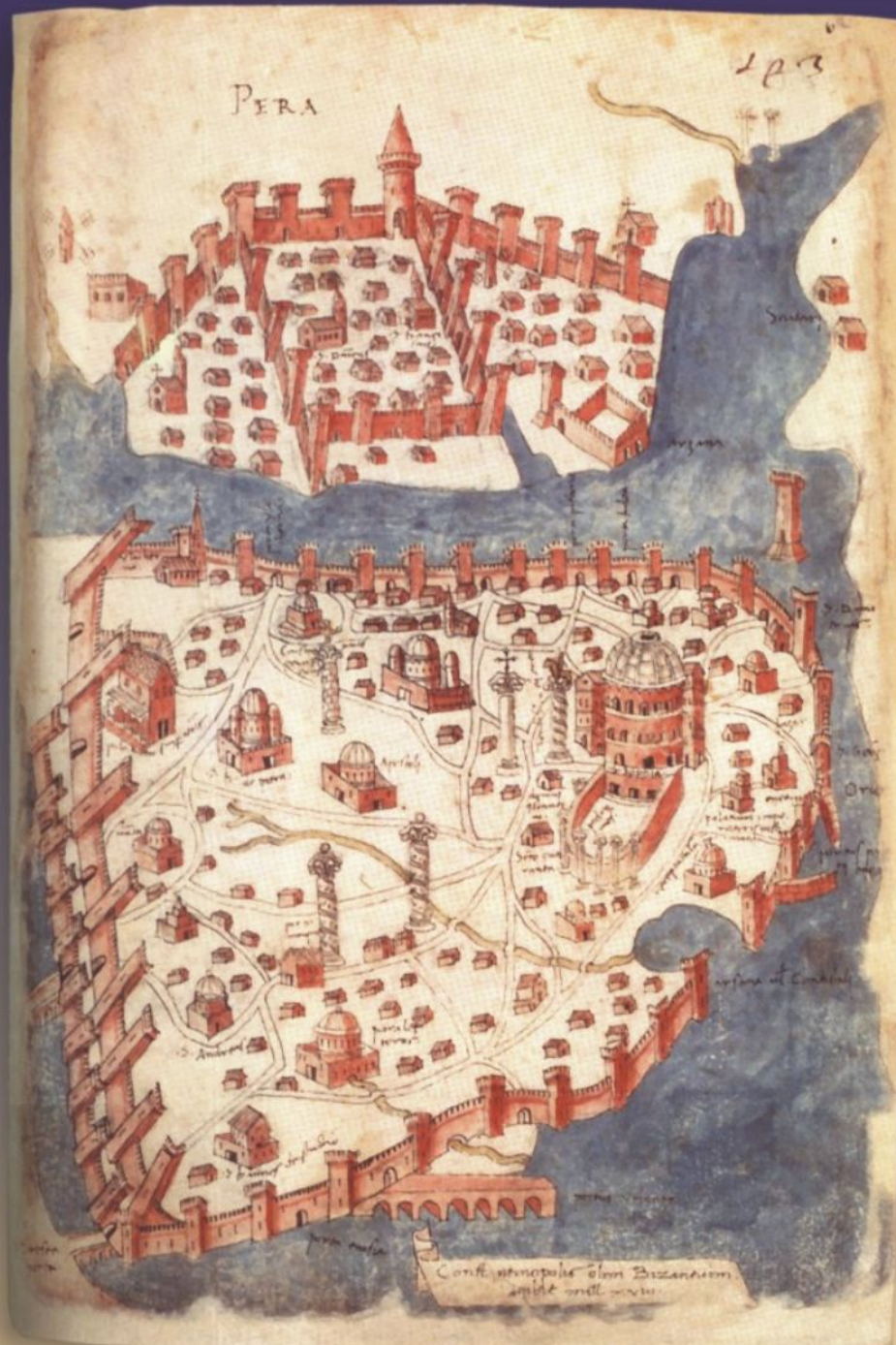
Carte de Constantinople, 1420