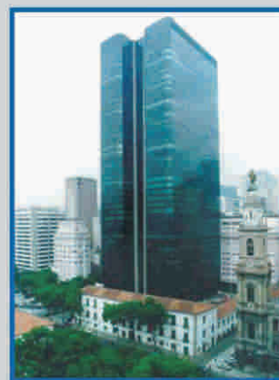
Universit  Candido Mendes, Rio de Janeiro, Br sil